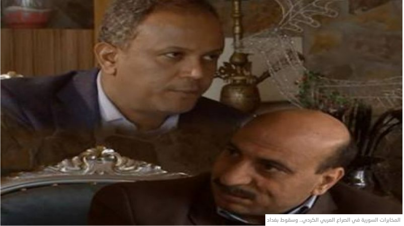
المخابرات السورية في الصراع العربي الكردي.. وسقوط بغداد

أورينت نت - نورس الحبيان تاريخ النشر: 20:00 26-05-2014