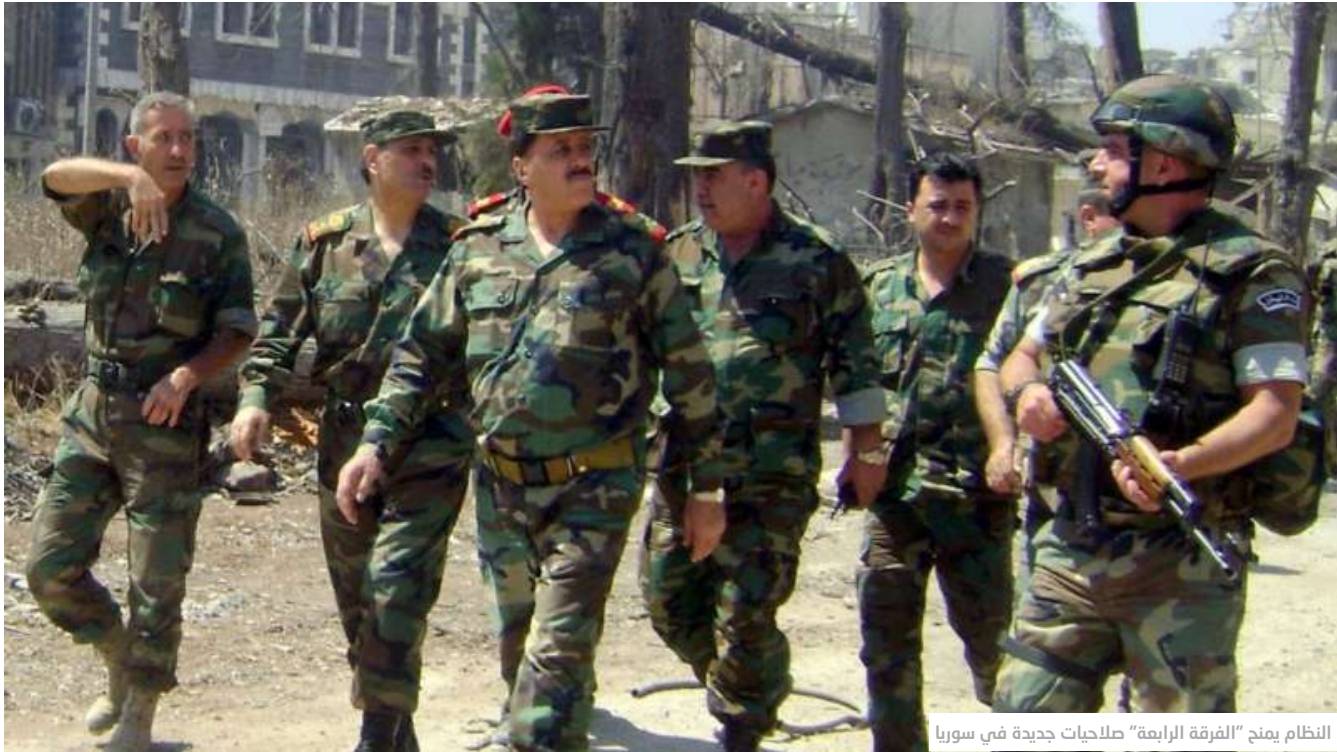
النظام يمنح "الفرقة الرابعة" صلاحيات جديدة في سوريا

أورينت نت - يزن التيم تاريخ النشر: 08-01-2018 07:43