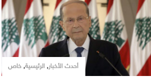
أحدث الأخبار، الرئيسية، خاص

«ميقاتي يا ميقاتي غيرتلي حياتي».. وهاب يُفرد عن الحكومة ويتوقّع انخفاضاً حاداً للدولاراً