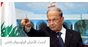
أحدث الأخبار، الرئيسية، خاص

القصف الإسرائيلي على سوريا يستهدف مواقع لـ«حزب الله».. وسقوط قتلى وجرحى!