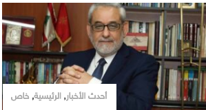
أحدث الأخبار، الرئيسية، خاص

لا فيتو من «حزب الله» على ميقاتي.. ويرفض تكرار تجربة حسان دياب!